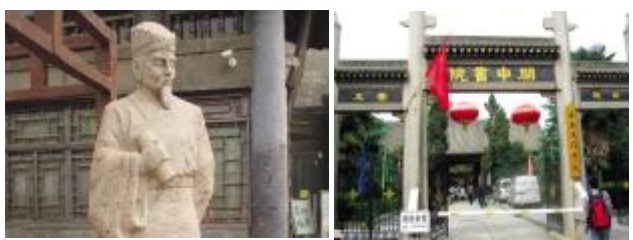
【冯从吾塑像；关中书院】

冯从吾历尽艰难曲折，惟对教书育人孜孜不倦。他认为国家正处在危难之中，更需要讲学，以唤起人心，才能有效地抵御外侮，安定天下。他特别强调“讲学就是讲德”，对古代直臣仁人的骨气节操，常表示钦佩不已，教育学生首先学会做人，做堂堂正正、品格高尚的人。冯从吾在宝庆寺讲学时，特意撰写一篇短文名曰《谕俗》：“千讲万讲不过要大家做好人，存好心，行好事，三句尽之矣。因录旧对一联：‘做个好人，心正、身安，魂梦稳；行些善事，天知、地鉴，鬼神钦。’”这是继承弘扬“关学”道统，以“提醒人心为己任”的讲学宗旨，也是以最通俗语言文字，对古圣先贤讲经明道进行的总结和概括。