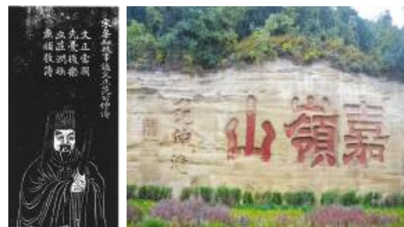
【范仲淹石刻像;延安宝塔山麓南川河东岸摩崖石刻,有延州知府范仲淹手书“嘉岭山”字】

“塞下秋来风景异,衡阳雁去无留意。四面边声连角起,千嶂里,长烟落日孤城闭。浊酒一杯家万里,燕然未勒归无计。羌管悠悠霜满地,人不寐,将军白发征夫泪。”