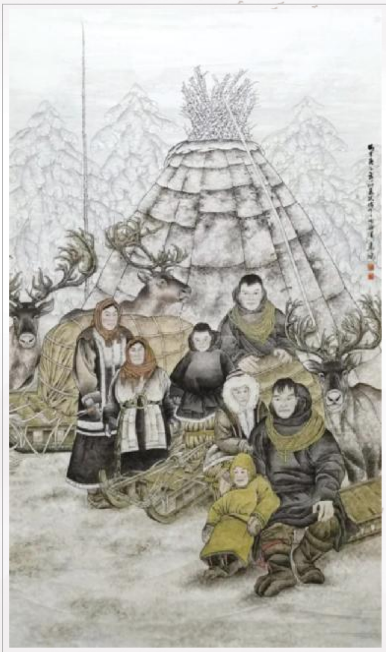
美术家协会理事 安颜博 黑龙江省美术家协会连环画艺术委员会秘书长、哈尔滨市青联委员、哈尔滨市 哈尔濱市政协书画院理事 哈尔濱画院专职创作员，黑龙江省美术家协会