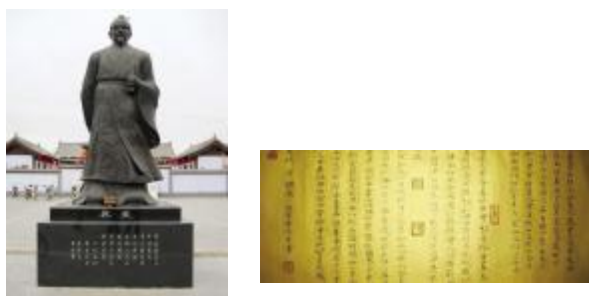
【魏征塑像;《谏太宗十思疏》,是贞观十一年(637)魏征写给唐太宗的奏章,劝谏太宗居安思危,戒奢以俭,积其德义。】

【以人为镜可以明得失】魏征患病去世后,太宗罢朝五日,“上登苑西楼,望哭尽哀。上自制碑文,并为书石。上思征不已,谓侍臣:‘夫以铜为镜,可以正衣冠,以古为镜,可以见兴替,以人为镜,可以知得失;魏征没,朕亡一镜矣!’”(吴兢《贞观政要》)