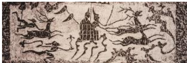
【汉画石《鹿车升仙图》】

每当遇到昏君在位、奸臣当道、世风日下,一些文人士大夫便会躲入大同世界的梦想中寻找精神安慰:如汉代神话中虚无缥缈的“神仙国”;东晋陶渊明描绘的一个没有剥削压迫、无贫富贵贱之分、人人劳动、生活安逸的“世外桃源”;宋代王禹偁在《录海人书》中的“海人国”;清代李汝珍《镜花缘》中的“君子国”,都可以看出作者想象中的乌托邦正是儒家大同社会理想。