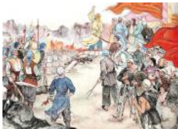
【绘画:《李自成起义》《太平天国起义》】

大同理想一直成为人民群众进行反抗变革的有力思想武器。东汉末年的黄巾起义,宣传“天之道,乐与人共之;地之有德,乐与人同之”,“财物乃天地中和所有,以共养也”。北宋初年王小波、李顺起义宣告“吾疾贫富不均,今为汝辈均之”的“均贫富”口号。南宋钟相、杨么起义宣传“我行法,当等贵贱,均贫富”口号。明末李自成起义,提出“均田免粮”、“平买平卖”、“公平交易”等口号。鸦片战争后爆发的太平天国起义,则提出“有田同耕,有饭同食,有衣同穿,有钱同使,无处不均匀,无人不饱暖也”的土地纲领与理想社会方案。