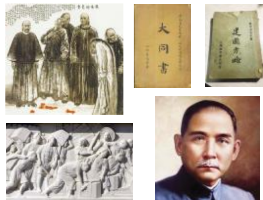
【国画《戊戌六君子》;康有为《大同书》;孙中山《建国方略》;浮雕《鸦片战争》;孙中山像】

现实,大同社会的美好愿景再次萦绕在中国人心中,从鸦片战争、洋务运动、戊戌变法、到辛亥革命,无数仁人志士为之披肝沥胆,前仆后继,奋斗不息。康有为《大同书》构想了“人人相亲,人人平等,天下为公”的理想社会。孙中山发出了“振兴中华”的号召,耗费半生精力写出了《建国方略》,为实现“天下为公”、“孔子所希望的大同世界”。理想而终生奋斗。李大钊等中国先进分子在俄国十月革命的影响下,看到了“世界的新文明之曙光”,把传统的“大同”思想与近代社会主义思想联通在一起,指出“中国向何处去”的答案,就是走十月社革命的道路,他新的社会理想——社会主义,来点燃改造中国社会的燎原烈火。