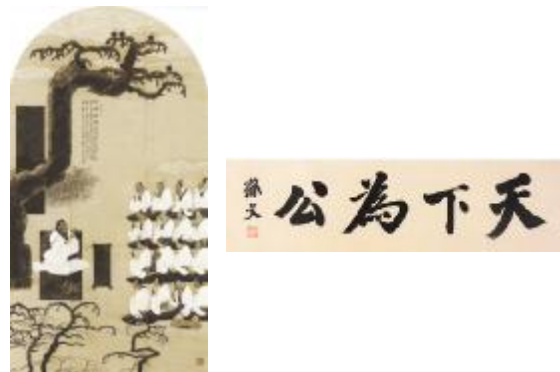
【孔子杏坛讲学;孙中山题:“天下为公”】

孔子的“大同世界”思想,早于马克思的《共产党宣言》两千三百多年,具备了共产主义社会的诸多特征,这是孔子对中华民族和全人类的一个极其伟大的贡献。