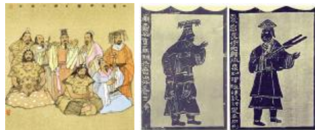
【“三皇五帝”图；汉代画像石中的舜禹】

在我国传说中的“三皇五帝时代”，燧人氏“教民钻木取火”，结束了先民茹毛饮血的野蛮时代；伏羲氏创立八卦，始造文字，教民作网用于渔猎，驯养野兽，变革婚俗，发明陶埙、琴瑟等乐器；炎帝神农氏，相传采尝百草，救民疾苦，制定历法，教人耕种。黄帝时代发明了如五谷、蚕桑、舟车、宫室、凿井、衣裳等，被尊为中华“人文初祖”。颛顼统一历法，帝喾划分四时节令，尧帝制定历法，“敬叫授民时”，禅位于舜。舜推行德教，以“五典”教民。《史记》云：“天下明德，皆自虞帝始”。